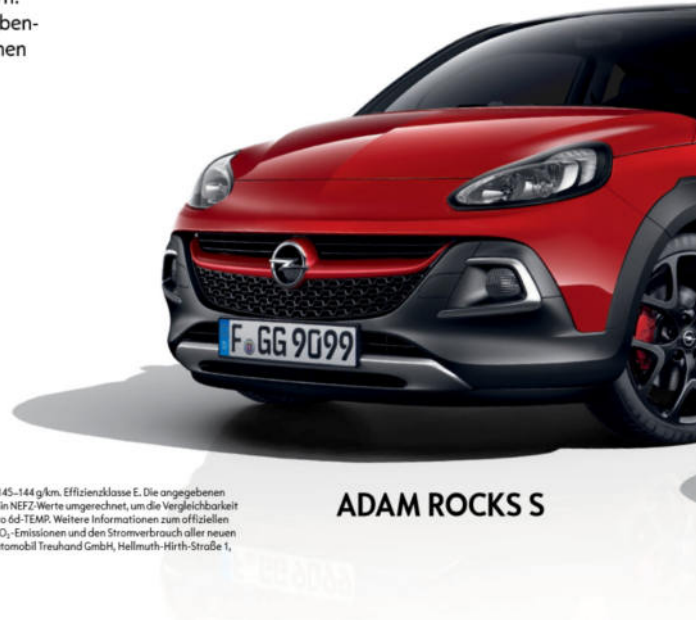
ADAM ROCKS S