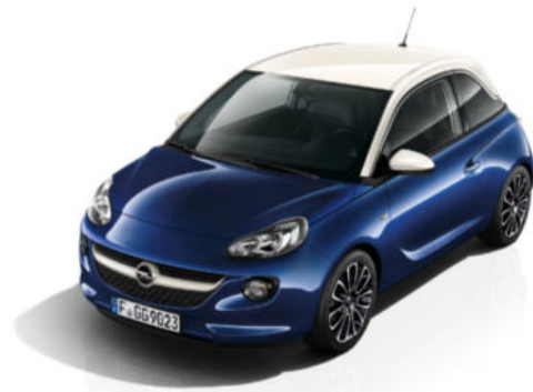
ADAM 120 JAHRE