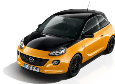
ADAM 120 JAHRE MIT BLACK JACK-PAKET

Serienausstattung zusätzlich zu bzw. abweichend von ADAM 120 Jahre: » Swing Top Stoff-Faltdach in Black