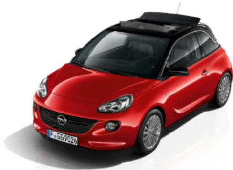
ADAM „OPEN AIR“ 120 JAHRE

Zeig mit Deinem ADAM, wie einzigartig Du bist! Denn beim Design hat nur eine Person das letzte Wort: Du. Mehr über die Individualisierungsmöglichkeiten erfährst Du auf opel.de